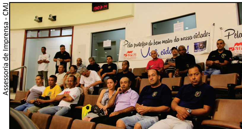
Câmara aprova aumento do adicional de risco de vida dos Guardas Civis